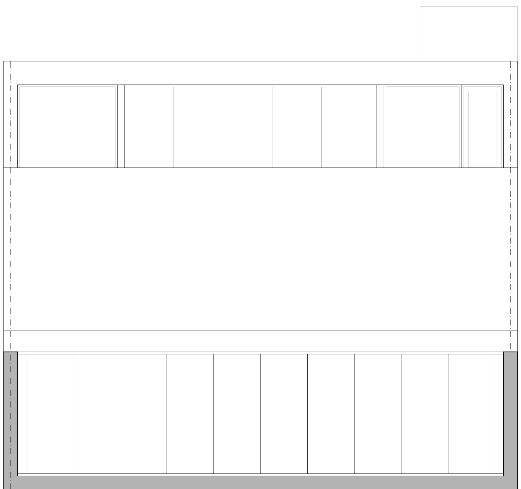
VISTA CONTRAFRENTE ESC. 1:50